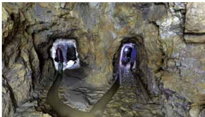
PRÍSTUPOVÉ ŠTÔLNE NA ŤAŽBU ŽELEZNEJ RUDY V ČASTI JAMEŠNÁ, ĽUBIETOVÁ.