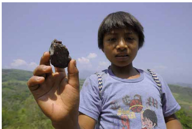
NÁLEZ MAYSKÉHO CHLAPCA KMEŇA ZOQQUE V BANI V PROVINCCII CHIAPAS.

Pochádza z bane na hranici Mexika a Guatemaly, kde bol P. Vršanský v roku 2012. „Je to dosť emotívny zážitok,“ povedal, keď opísal podmienky v bani v provincii Chiapas, v ktorej pracujú Mayovia z kmeňa Zoqqe. Vráťane 10-ročných detí. „V teplote 45 stupňov a skoro stopercentnej vlhkosti. A z nášho hľadiska prakticky zadarmo. Vyťaženy jantár sa predáva na kilá, tie najlepšie vzory sa dostanú do rúk vedcom. Je to zaväzujúci výskum aj tým, že vedci cítia akúsi povinnosť nejako to miestnym ľuďom vrátiť,“ vra-