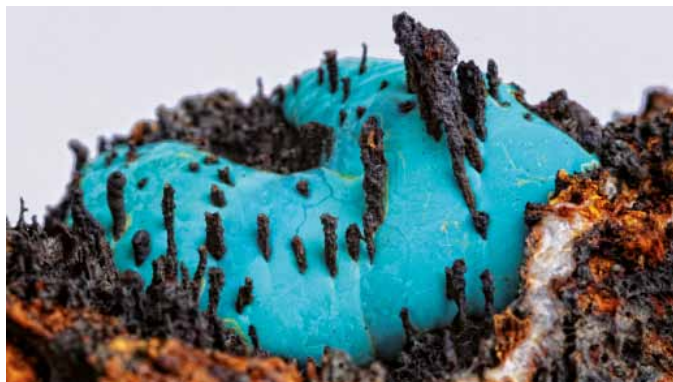
OBĽIČKOVÝ AGREGÁT PSEUDOMALACHITU A FE OXIDY NA KREMENI, CU LOŽISKO ĽUBIETOVÁ PODLIPA.