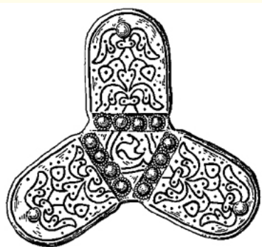
KRESBA STRIEBROM TAUZOVANÉHO KOVANIA ZÁVESU MEČA.

V rámci hradísk sa dosiaľ nepodarilo objaviť sakrálny objekt. Dodnes stojaca rotunda z tejto doby v Nitrianskej Blatnici je však od centrálného hradiska Bojná I-Valy vzdialená len štyri kilometre a zrejme tvorí súčasť pôvodnej sídliskovej aglomerácie. V náročnom lesnatom teréne sa nám doposiaľ nepodarilo objaviť jeden z dominantných zdrojov informácií – hroby pôvodných obyvateľov. Len v polohe Bojná III-Žihľavník v polohe