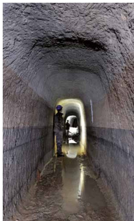
Štôlna na ťažbu železnej rudy, vyrazená v sopečných horninách v časti Jamešná, Ľubietová.

Podľa informácií od tvorcov sa objavil aj záujem o vystavenie panelov na Univerzite Friedricha Schillera v Jene a v Deutsches Bergbau-Museum v Bochume, v Nemecku. (pod)