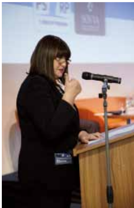
BRATISLAVSKÉ OTVORENIE HORIZONTU 2020 V JANUÁRI MINULÉHO ROKU. NA SNÍMKE JE EURÓPSKA KOMISÁRKA PRE VÝSKUM MÁIRE GEOGHEGAN-QUINN.

Z hľadiska zapojenia Slovenska do 7. rámcového programu sa výskum bezpečnosti z rozličných hľadísk hodnotil na 1. až 4. mieste a súťažil s výskumom v iných, omnoho viac „zaľudnených“ odboroch. V EÚ sme sa umiestnili na 18. – 19. priečke, vo financovaní vedy pritom obsadzujeme 24. pozíciu. S výsledkami by bolo možné vysloviť spokojnosť s výnimkou toho, že potenciál SAV nebol v tejto sfére využitý. Určitou kompenzáciou je, že projekt SECRICOM, v ktorom popri Ústave informatiky SAV participovali Ardaco a Geothermal Anywhere, presadil sa do výberu 15 najúspešnejších projektov zo spomínaných vyše tristo.