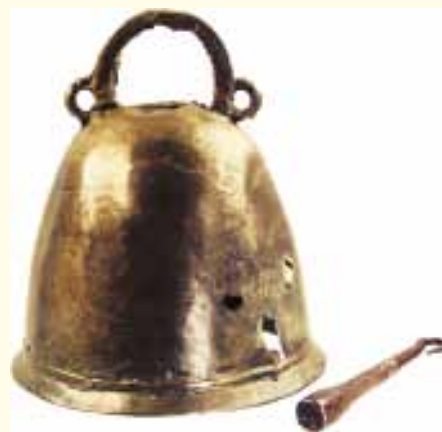
STREDOVEKÝ BRONZOVÝ ZVON Z BOJNEJ – JEDEN Z NAJSTARŠÍCH V EURÓPE.

Azda najvýznamnejšími nálezmi sú doklady kresťanského kultu. Súbor šiestich pozlátených reliéfnych plakiet znázorňujúcich anjelov a Krista pôvodne zdobil drevenú schránku – prenosný oltár alebo relikviár. Dve z plakiet nesú krátke texty písané latinkou, čo sú prvé priame dokla-