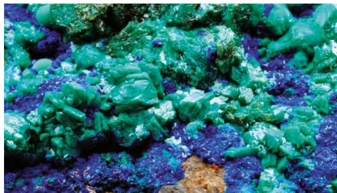
AGREGÁT KRYŠTÁLOV EUCHROITU (ZELENÝ) A AZURITU (MODRÝ), LOKALITA PONIKY-FARBIŠTE.