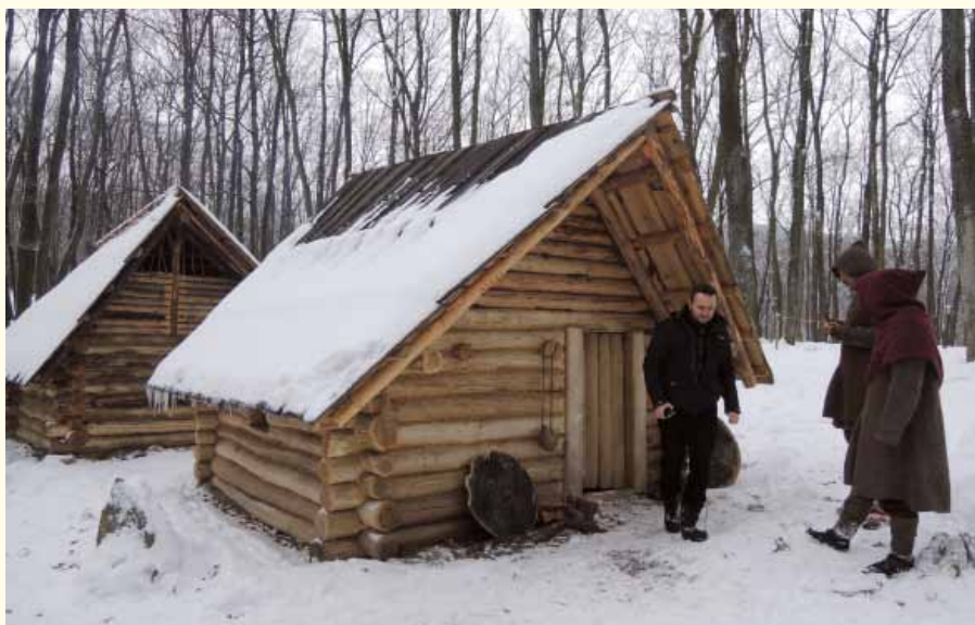
VYKUROVANIE A IZOLÁCIU MODELOVÝCH REKONŠTRUKCIÍ SLOVANSKÝCH OBYTNÝCH DOMOV TESTOVALI DOBROVOĽNÍCI.

Zdá sa teda, že Bojná, novoobjavené centrum na strednom Ponitří, dosiahla svoj prvý rozvoj ako jedno z centier Pribinovo Nitrianskeho kniežatstva. Aj neskôr, po jeho pričlenení k Veľkomoravskej ríši, zo-