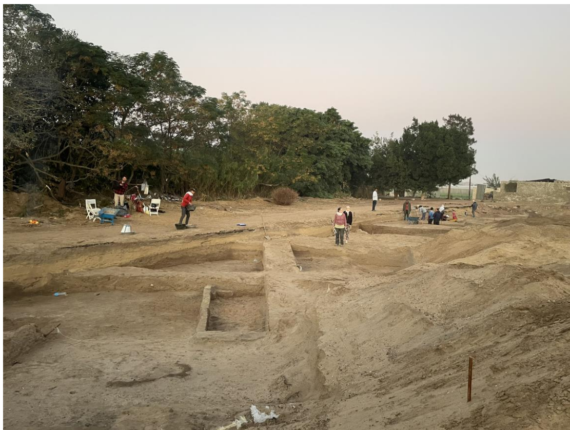
Plocha výskumu v oblasti 7 počas sezóny v roku 2023.