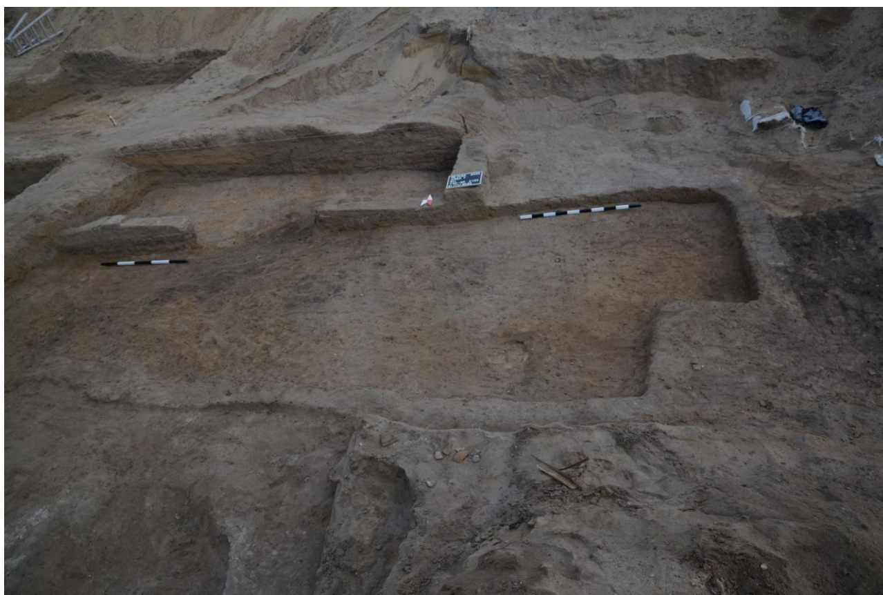
Zvyšky domu z 18. dynastie v oblasti 7.