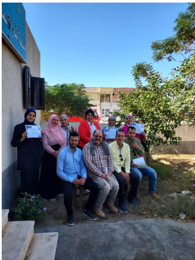
Školenie egyptských inšpektorov počas sezóny 2023.