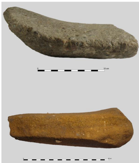
Dva príklady staroegyptských zrnotierok analyzovaných v štúdií Grinding through ages....