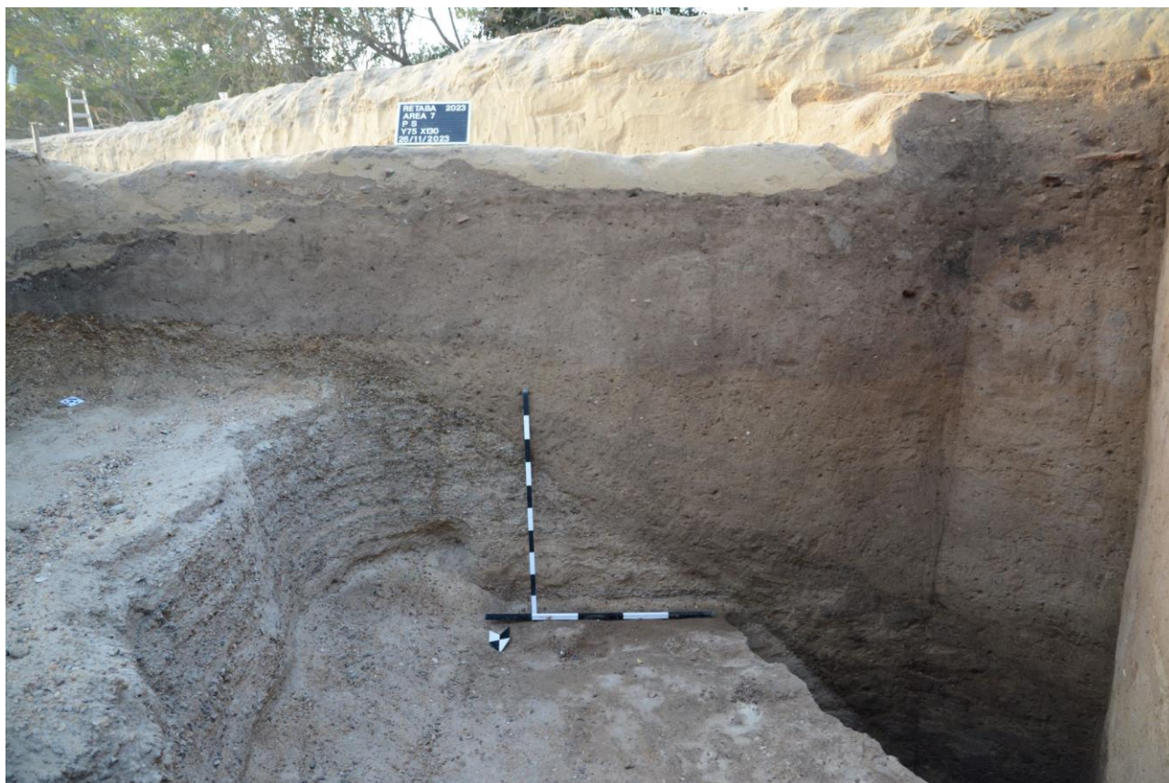
Priekopa vyplnená neskoršími vrstvami, viditeľná v profile sondy.