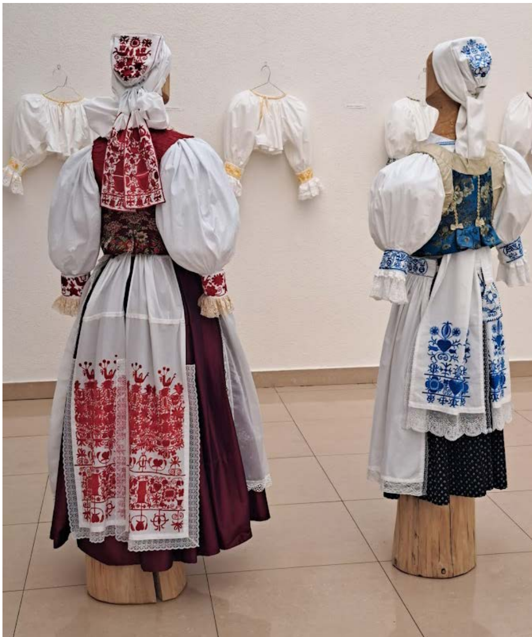
Obr. 2 Rekonštrukcia tradičného ženského odevu