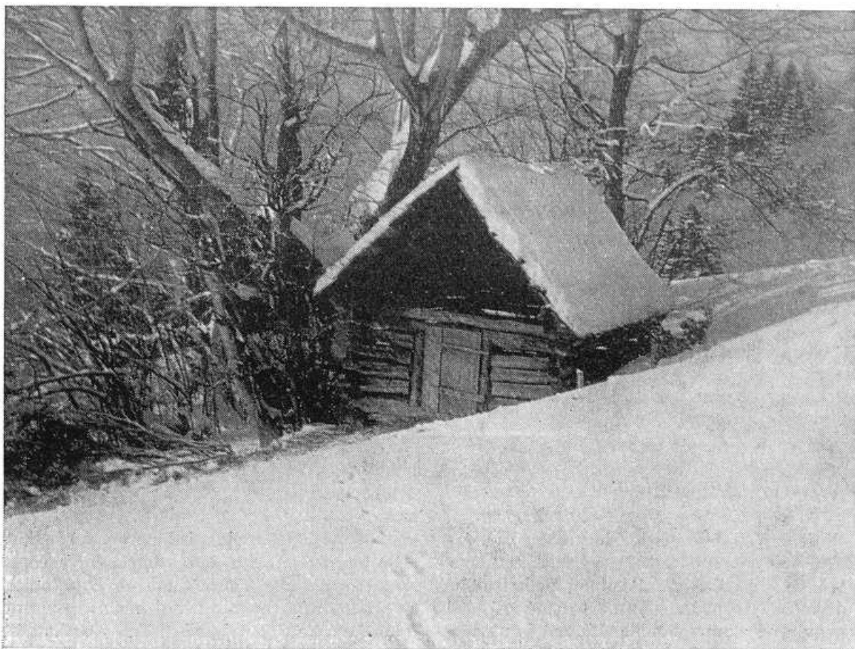
Obr. 1. Senník na dolnom okraji lúk Vápenné.*

vrchu Lysec (n. v. 1381 m, výškový rozdiel oproti dedine 880 m). Úpätie tohto vrchu tvoria strmé zalesnené svahy, nad nimi v strednom pásme sa rozkladajú úrodnejšie lúky so senníkmi a hornú časť s temenom pokrývajú menej úrodné lúky (bez senníkov), ktoré sa v súčasnom družstevnom hospodárení postupne premieňajú na pasienky pre mladý hovädzí dobytok. Horské lúky v strednom a hornom pásme Lysca, rozložené v častiach Vápené, Jedlovské, Čremošné, Struhárov, Prietrž, Polka, Úplazy a Straka , sú obklopené strmými zalesnenými svahmi a nie sú prístupné bežne používaným dopravným prostriedkom. Hnojenie týchto lúk sa vykonáva košarovaním oviec.