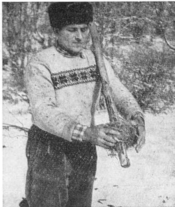
Obr. 7. Upevnenie putka na ražni.

zhora na vyčnievajúci drúk. Veľkosť senníkov pri ich budovaní sa usmerňovala podľa veľkosti lúčnej plochy, z ktorej sa uskladňovalo v senníku seno. V doteraz zachovalých senníkoch sa uskladňuje 15–22 q sena. V súčasnosti sú všetky senníky na lúkach v kolektívnom vlastníctve jednotného roľníckeho družstva, pričom sa však naďalej rozlišujú označením podľa mena pôvodných majiteľov (napr. Brzákov senník — alebo Brzákov štálov , Podhradských senník , Sumkov senník ap.).