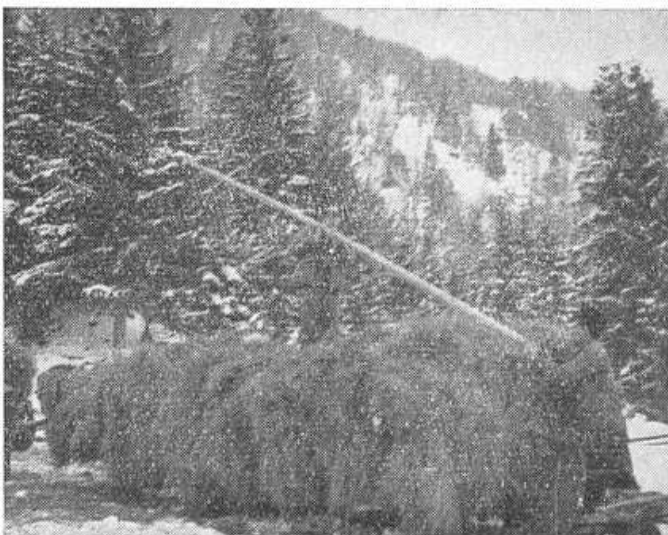
Obr. 19. Upevňovanie sena na vláchoch pomocou pavúza.