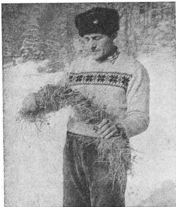
Obr. 6. Príprava putka zo sena.

zhora na vyčnievajúci drúk. Veľkosť senníkov pri ich budovaní sa usmerňovala podľa veľkosti lúčnej plochy, z ktorej sa uskladňovalo v senníku seno. V doteraz zachovalých senníkoch sa uskladňuje 15–22 q sena. V súčasnosti sú všetky senníky na lúkach v kolektívnom vlastníctve jednotného roľníckeho družstva, pričom sa však naďalej rozlišujú označením podľa mena pôvodných majiteľov (napr. Brzákov senník — alebo Brzákov štálov , Podhradských senník , Sumkov senník ap.).