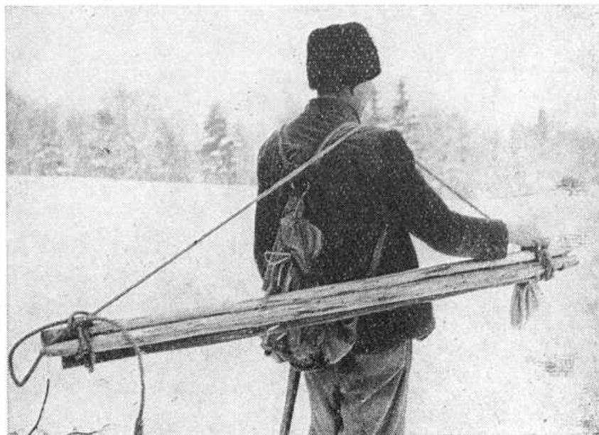
Obr. 2. Výstroj muža s drevenými ražňami pri odchode na lúky.