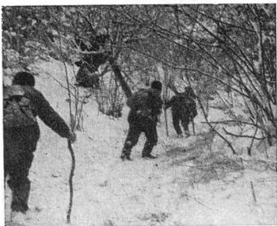
Obr. 3. Výstup na lúky hore úplazom.