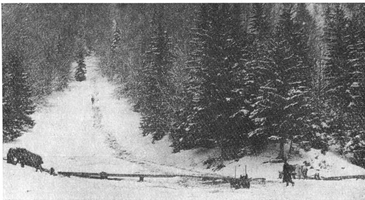
Obr. 4. Záprah s povozmi pri dolnom ústí úplazu.