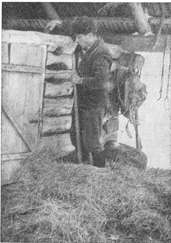
Obr. 11. Stláčanie sena v plnom ražni pomocou liehy zapravenej do zrubu.