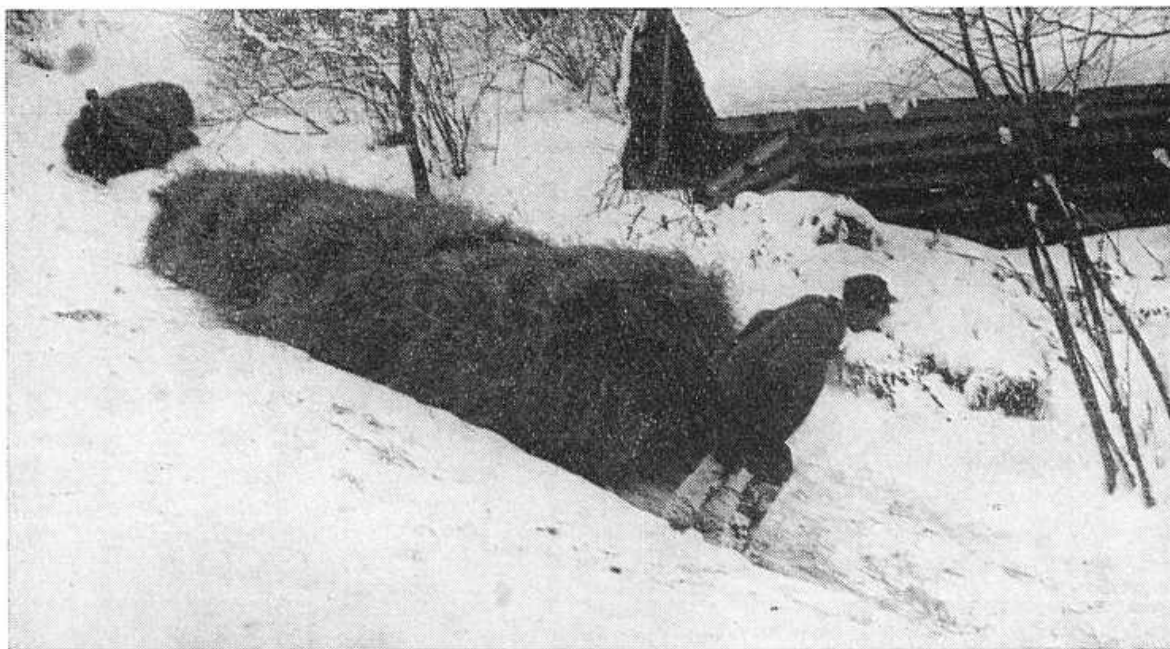
Obr. 15. Stahovanie sena (ražne spojené v klúči ) dole úplazom.

bradkom k zrubu. Jeden muž vojde do senníka podávať seno, druhý odoberá seno a upevňuje ho na ražeň. Najprv sa na postavený ražeň napichne zo sena ukrútené putko , ktoré sa pritlačí k drevenému klinu vedľa hlavice. Za putkom sa napichne na ražeň pevnejší plášť uľahnutého sena. Ďalšie plášte sena sa už nenapichujú na ražeň, ale sa obkladajú okolo ražňa na spodný plášť. Keď je na ražni založený pevný základ, muž obsluhujúci ražeň začne ukladané seno stláčať