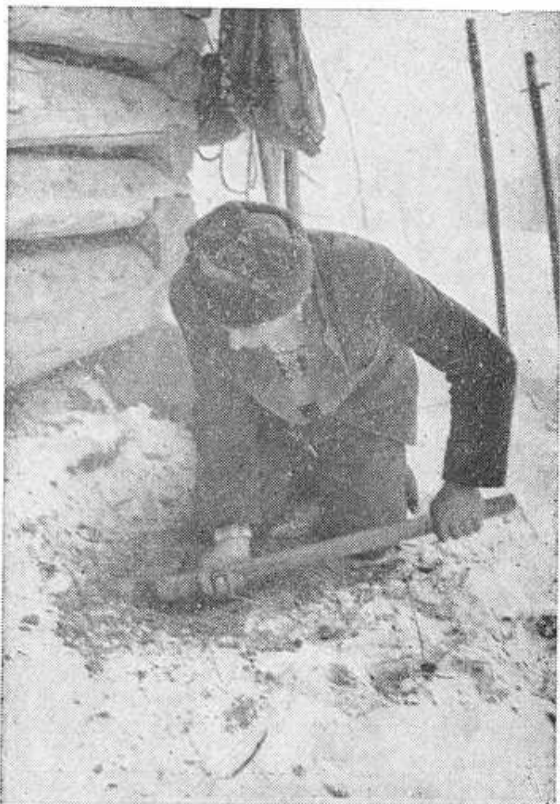
Obr. 8. Vyhľbovanie jamy pre ražeň pri zrubu senníka.