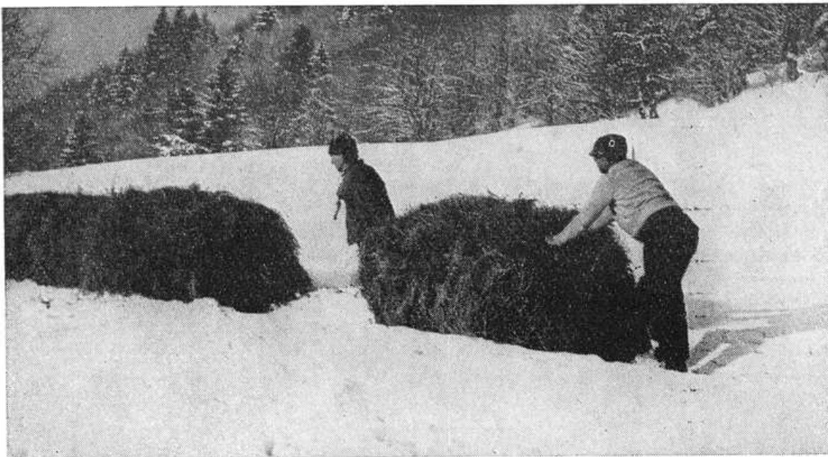
Obr. 14. Spájanie plného ražňa do klúča .