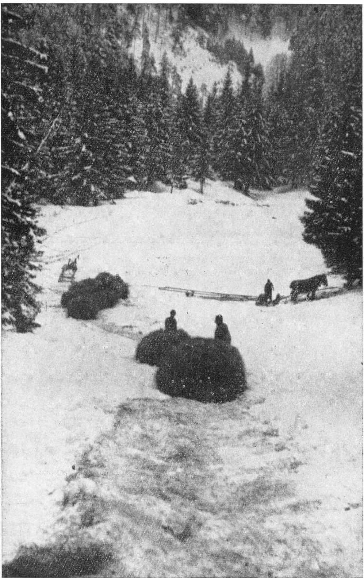
Obr. 16. Dolné ústie úplazu s nákladom.