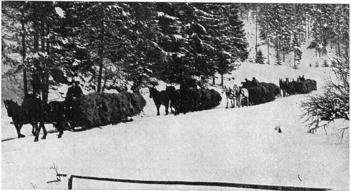
Obr. 20. Odvoz sena na vlákoch do dediny.

čom zväzok silnejších rozvetvených smrečkov, na ktoré sa posadí muž dopravujúci seno do doliny.