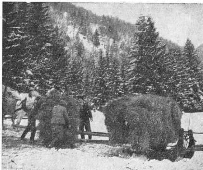
Obr. 17. Nakladanie plných ražňov na vláky.

Po nabratí sena na ražne a po spojení ražňov do kľúčov nasleduje sťahovanie a spúšťanie sena dole svahom do doliny. Keďže strmé svahy pod pásmom lúk sú zarastené hustým lesom, na spúšťanie sena dole strmým svahom sa používajú tzv. úplazi , t. j. hustým lesom vyrúbané úzke prechody smerujúce priamo zhora nadol a vodou vyhlbené vo forme žlabov. Ináč slúžia úplazy aj na spúšťanie dreva do doliny. Pri vrchnom vyústení úplazu na lúčnom priestranstve sa zoradia po sebe jednotlivé kľúče. Každý muž dopravuje dolu úplazom jeden kľúč (spojených 4–5 ražňov) sena. Na predný ražeň sa upevní povrázok, za ktorý sa kľúč ťahá dole úplazom až po najstrmší svah. Keď spúšťaný kľúč začne vo svahu naberať rýchlость, muž spred kľúča odstupí vedľa dráhy a zachytí sa na posledný ražeň, na ktorom sa zvezie až do doliny. Ak je seno v štvorbokých ražňoch dobre postláčané a ak sú ražne pevne pospájané v kľúči, zošmykne sa kľúč dole prudkým svahom (často aj rýchlостou 30–50 km) bez toho, že by vykoľajil z vyhlbeného úplazu vedľa do lesa. Ak je povrch snehu zľadovelý a spúšťanie sena je nebezpečné, pripevňuje sa na hamovanie za každým kľú-