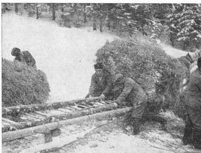
Obr. 18. Nakladanie plných ražňov na vláky.