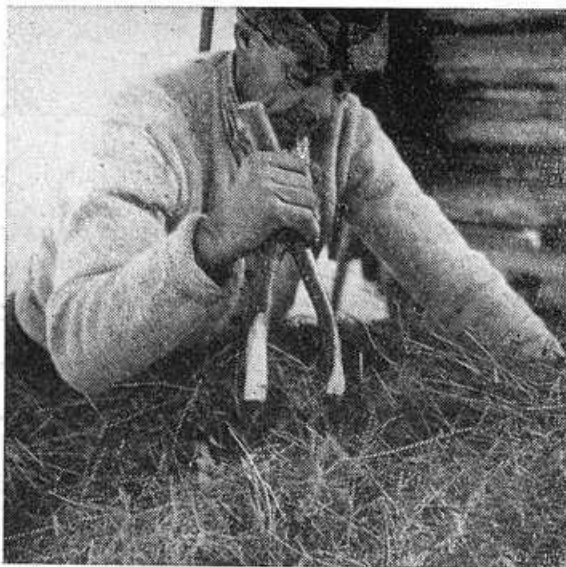
Obr. 13. Detail sošiek na formovanie ražňa.

Termín zimného zväžania sena zo senníkov do dediny závisí od dostatku zásob sena, ktoré sú uložené v dedine. Asi tretinu úrody sena zvykli súkromne hospodáriaci roľníci uskladňovať v dedine hneď koncom leta. Druhú časť úrody dopravovali z bližších a ľahšie prístupných senníkov asi v decembri. Nakoniec zväžali sena z najodľahlejších horských lúk z Lysca. Doprava sena z horských lúk závisela však aj od dostatku snehu, preto sa s ňou vyčkávalo obyčajne až do januára—februára, ba i do marca.