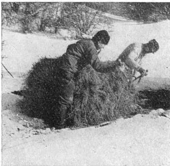
Obr. 12. Formovanie plného ražňa pomocou sošiek.