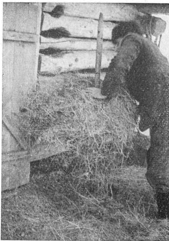
Obr. 9. Napichnutie plášťa sena na ražeň.