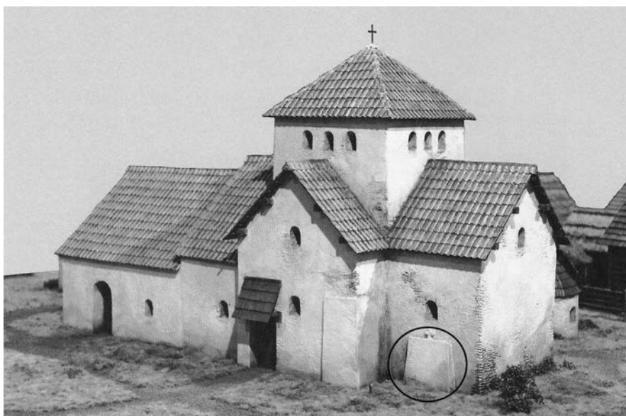
Obr. 2. Model predpokladaného arcibiskupského chrámu v lokalite Sady – Uherské Hradište. V stene presbytéria označená prímurovka hypotetického Metodovho hrobu. Zdroj: Galuška, L.: Křesťanství v období byzantské misie..., c. d., s. 76, obr. 2. Úprava: A. Botek.