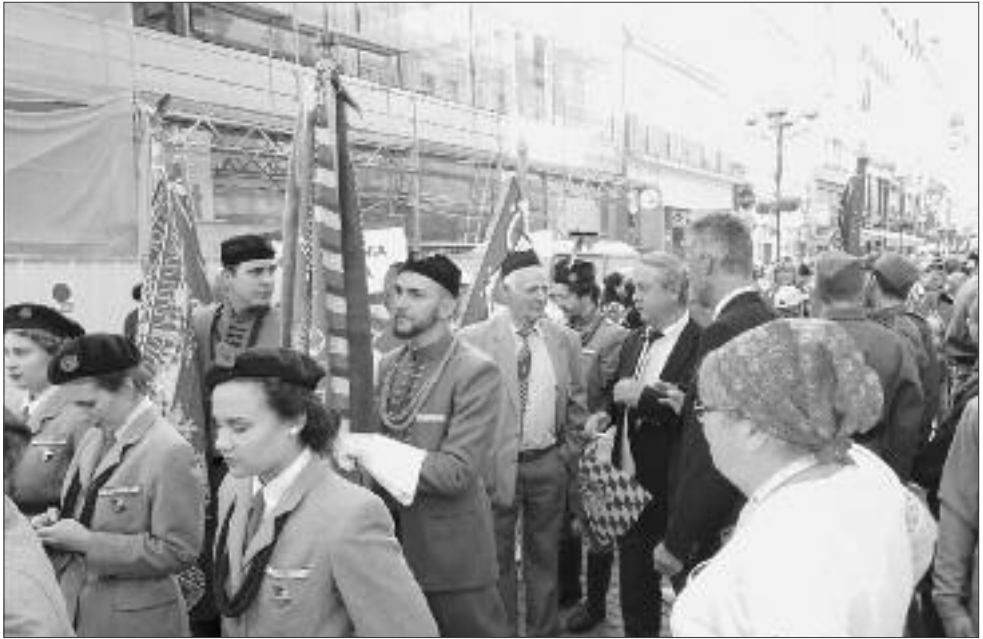
Sprievod sokolov Prahou. Foto: M. Ďurech, 2018

jav ukončila tradičným pozdravom: Sestry a bratři, nazdar , odpoveď hľadiska znela: Zdar .