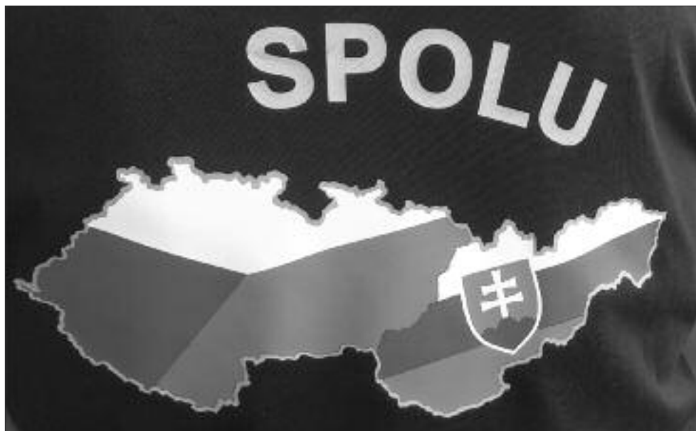
Tričko skladby „Spolu“, Praha.

časť skladby. 11 Slovenská autorská dvojica vytvorila tretiu a zároveň záverečnú časť skladby, čím v prípade prvého programového dňa, keď táto skladba bola posledná v poradí, vytvorila aj celkové finále programu. Aj to skladbu predurčovalo, aby bola veľkolepá, emotívna, výrazovo silná. Ústrednou myšlienkou skladby sa stali rozchody a spájania oboch republík. Primerane tejto myšlienke bola zvolená hudba celej skladby. Jej prvá časť bola v polkovom štýle na nostalgickú pieseň Škoda lásky v podaní Karla Gotta. Druhá časť v štýle aerobiku sa cvičila na skladbu Zrkadlo od Jaromíra Vejvodu v podaní Karla Černocho, táto skladba sa končí symbolicky zvukom rozbitého skla – rozpadu. Upokojením a postupným rozvinutím témy do pompézneho finále bola tretia časť skladby na hudbu piesne známej pod názvom Ná, ná, ná skupín No Name (slovenskej) a Chinaski (českej). Text piesne je príbehom priateľov – Čecha a Slováka, ktorí nadväzujú na priateľstvá svojich českých a slovenských rodičov a tešia sa na vzájomnú návštevu v rozdelenom Československu. Skladba je striedavo v českom a slovenskom jazyku, známa je z českých a slovenských médií, ideovo silný je jej refrén zdôrazňujúci pokojné rozdelenie Československa v roku 1993 formou dohody: