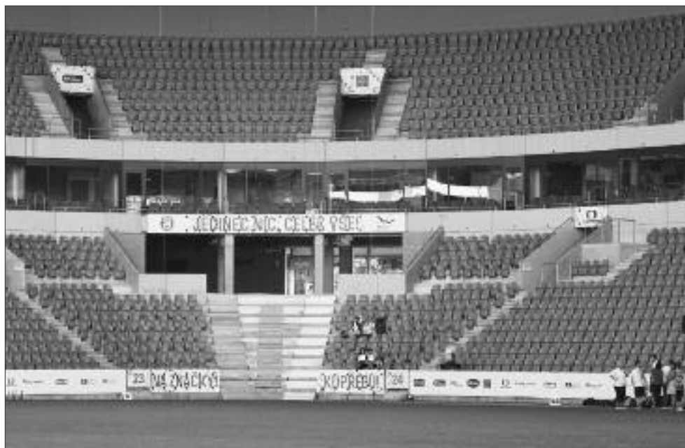
Sokolské heslá na štadióne Eden.

je skôr okrajová, sokolské symboly vnímame skôr ako historické prežitky. Napríklad v bratislavskej Sokolovni sa nachádza stará sokolská vlajka, dosť špinavá a zodratá. Namiesto toho, aby bola ako historický relikv s pietnou úctou ošetrovaná, dali vyrobiť novú. Slovenky sú zamerané skôr na prítomnosť a budúcnosť ich Sokola, ktorú vidia v spoločnej účasti na prehliadkach hromadných pódiových skladieb v zahraničí. Na rozdiel od Slovenska Českej obci sokolskej patrí aj v súčasnosti významné miesto na poli telovýchovnom aj vzdelávacom a v Čechách má obrovskú spoločenskú, ba aj finančnú podporu.