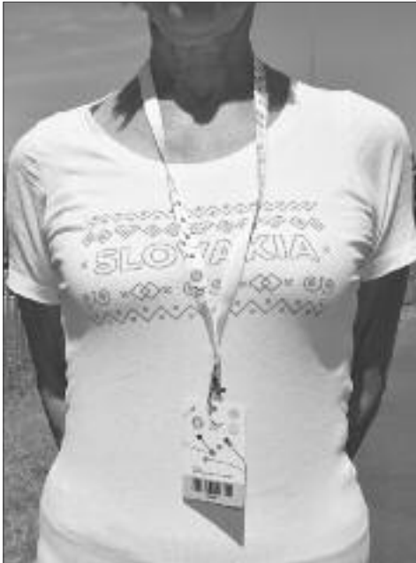
Sokolka z Bratislavy.