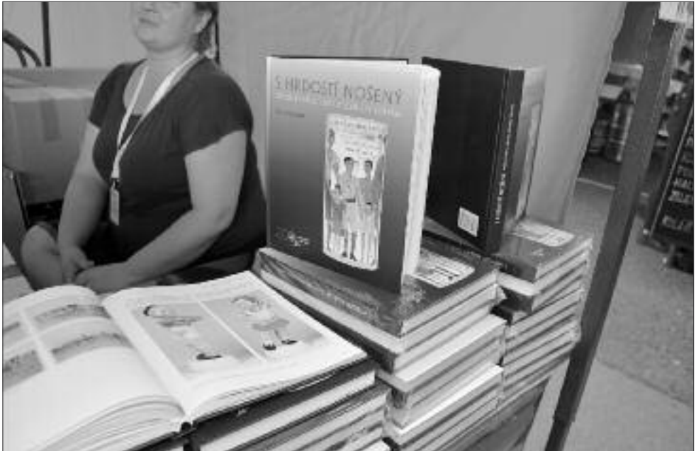
Predaj suvenírov a publikácie o sokolských krojoch v športovom areáli Eden.

Počas spoločnej skladby dochádzalo k priamemu kontaktu príslušníčok oboch krajín najmä pri nástupe na skladby. Neskôr na štadióne sa rôzne prúdy rozdelili tak, že každá skupina cvičila relatívne izolovane. K opätovnému spojeniu došlo pri odchode zo štadióna, čiastočne v šatniach, čo boli príležitosti na vyjadrenie si vzájomných sympatií.