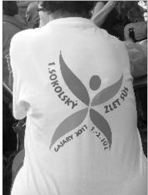
Prejav príslušnosti k Sokolskej únii Slovenska, Košúty.

Skladba mala svojím obsahom zdôrazniť priateľský vzťah Čechov a Slovákov. Myšlienkovým posolstvom bola prispôsobená aj farebnosť úborov: základ tvorila svetlomodrá, avšak všetky ženy mali ukryté „krídelká“ (rukávce) v troch farbách – bielej, červenej a tmavšej modrej, ktoré v príhodnej chvíli rozvinuli a vo zvyšnej časti skladby táto československá trikolóra dotvárala choreografiu. Prekvapením pre divákov, ale aj pre slovenské cvičenky, ktoré sa s mužskou zložkou skladby stretli až v Prahe, bol záverečný nástup mužov so zrolovanými zástavami, keď z okrajov štadióna vbehli do jeho stredu, vytvorili kruh s pyramídou z tiel a tí, čo stáli navrchu, viali rozprestretými veľkými československými zástavami. Záver skladby bol patetický, avšak v danej situácii mimoriadne pôsobivý – obzvlášť počas prvého večera, keď tvoril záver a vyvrcholenie celého programu. V druhý programový deň bola skladba zaradená v popoludňajšom programe ako prvá a mala navodiť atmosféru celého nasledujúceho programu.