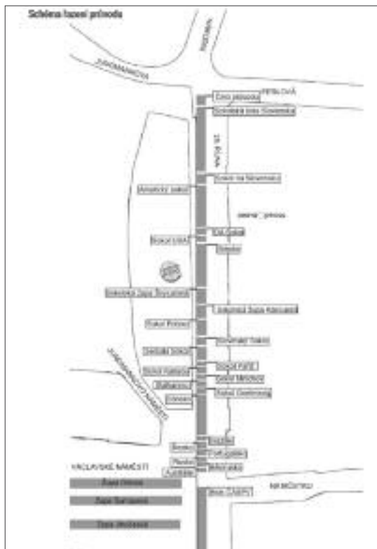
Schéma nástupu na sprievod zahraničných delegácií Sokola svedčí o ich pestrom zahraničnom zastúpení (XVI. všesokolský slet.).

vodu a týchto vystúpení sa všesokolský zlet dostal do povedomia návštevníkov Prahy. 9