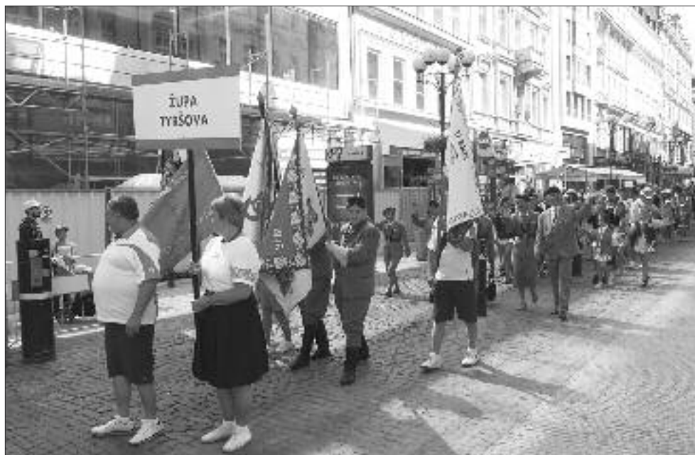
Sprievod sokolov Prahou.

mnoho vlajkonosičov v sokolských uniformách alebo cvičebných úboroch. Funkcia opatrovateľa vlajky je v českých sokolských organizáciách tým vážnejšia, čím je vlajka staršia. Na ploche boli aj historicky významné zástavy, ktoré Sokolom venovali prezidenti Masaryk a Beneš. Na úvodnom ceremoniáli ladenom do modro-bielo-červenej farby sa zúčastnilo asi 2000 osôb, čo bolo viac, než mala najpočetnejšia skladba v Programe (1500 cvičencov). Po cca 20-minútovom úvode sa začal program skladbou sokolských senioriek a seniorov, nazývaných aj „verná garda“, ktorá údajne od roku 1994 nechýbala na žiadnom zlete. Prvý deň bol ukončený československou skladbou „Spolu“.