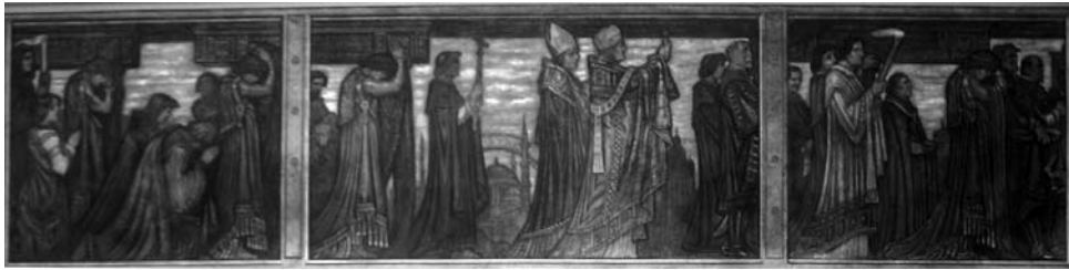
Obr. 9: Andor Dudits: Pohrebný sprievod, horná časť Rákociho triptychu, 1914 – 1916, nástenná maľba, Dóm sv. Alžbety, Košice.