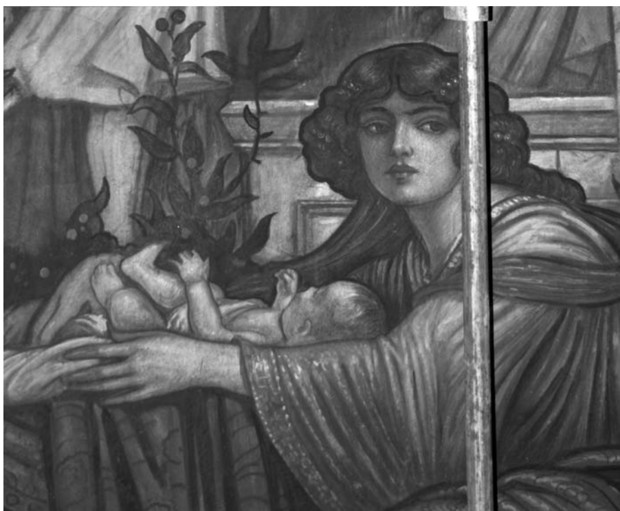
Obr. 7: Andor Dudits: Helena Zrinska, detail Rákocsiho triptychu, 1914 – 1916, nástenná maľba, Dóm sv. Alžbety, Košice.

Súťaž na košickú maľbu, ktorú Dudits vyhral, mala podľa predstáv komisie a jej pokynov dotvoriť severnú stenu transeptu, 13,5 m vysokú a 8,5 m širokú, s tým, že sa bude rešpektovať jestvujúce architektonické členenie a severný portál. 61 Maľba mala vystihovať osobnosť Františka II. Rákociho a zvečňovať pamiatku nielen na neho, ale aj na jeho druhov. Zároveň mala umocňovať atmosféru gotického chrámu, ale nie natoľko, aby nezohľadňovala barokovú dobu, v ktorej Rákoci žil. 62 Komisia