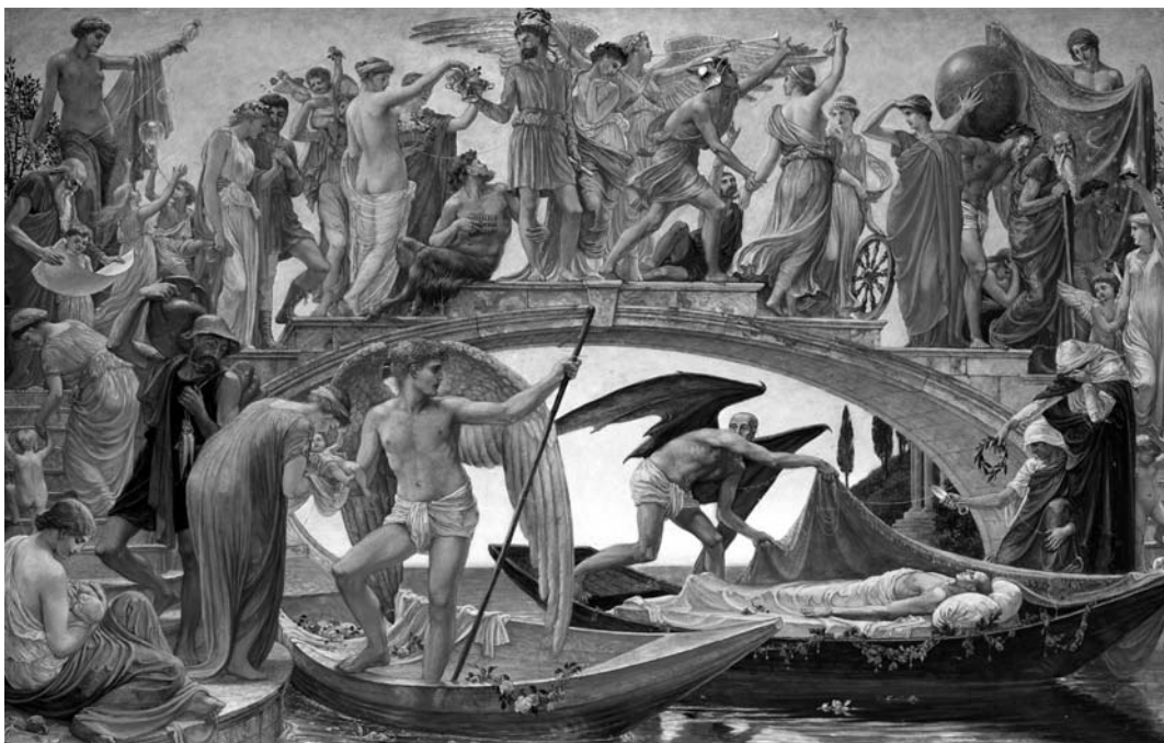
Obr. 3: Walter Crane: Bridge of Life , 1884, olejomalba na plátne, súkromný majetok.

života ( Az élet hídjá ), reprodukovaná vo Vasárnapi Ujság . 55