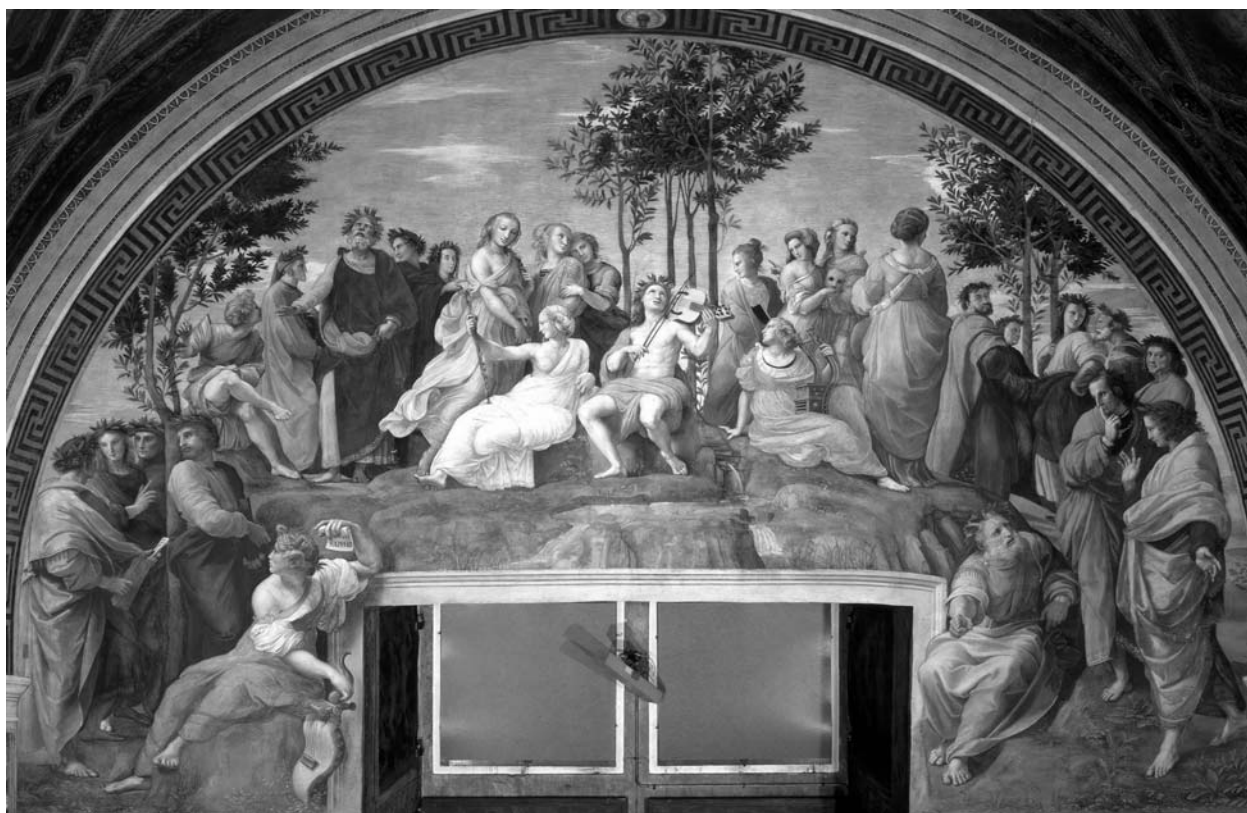
Obr. 2: Raffael: Parnas, 1509 – 1511, freska, Apoštolský palác, Vatikán.

ako stojí pri lôžku manželky Charlotte Amalie a berie ju do náruče. Očakávala narodenie ich tretieho syna Jozefa, preto má pri sebe zobrazenú pestúnku a košíku. Všetci zdesene upierajú zrak do zadnej časti komnaty, kde sa z prítmnia vynárajú prichádzajúci vojaci. Dramatickosť výjavu je dosiahnutá prudkým osvetlením hlavných postáv a ponurost'ou priestoru s nepriateľskými narušiteľmi. Maľba s uvoľneným maliarskym rukopisom má sviežu farebnú skladbu a pôsobivú hru svetla a tieňa.