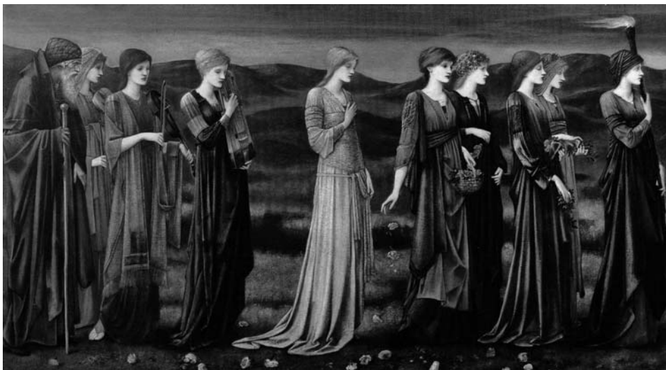
Obr. 10: Edward Burne-Jones: The Wedding of Psyche, 1894 – 1895, olejomalba, Kráľovské múzeum krásnych umení, Brusel.

kých rámov steny. V troch po sebe idúcich výjavoch zachytáva prenesenie pozostatkov Rákociho a jeho blízkych do Uhorska. V každom výjave je sedem postáv, ktoré dovedna vytvárajú pohrebný sprievod. Rovnako odeté postavy v dlhom ozdobnom rúchu so sklonenými hlavami nesú tri rakvy. Dve iné postavy sprievodu majú horiace fakle. Vpredu kráčajú členovia Štátnej pamiatkovej komisie a Uhorskej akadémie vied: Gyula Forster, Kálmán Thaly, Vilmos