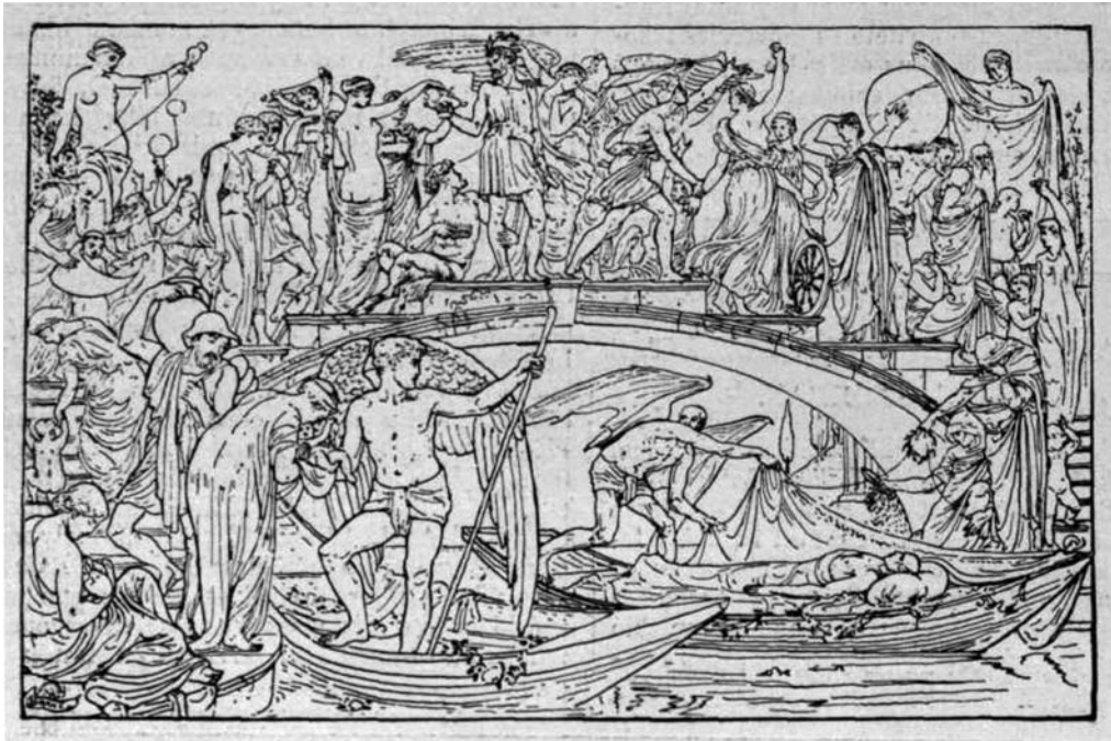
Obr. 4: Walter Crane: Bridge of Life , okolo 1884, drevorez na papieri, vystavený v Múcsarnoku. Repro z Vasárnapi Ujság 27. 10. 1895, s. 712.