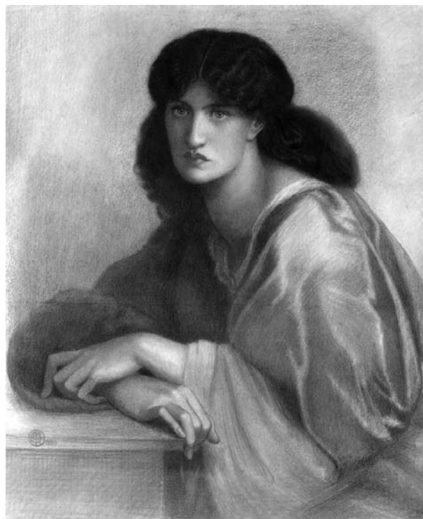
Obr. 8: Daniel Gabriel Rossetti: La Donna della Finestre (Jane Morris), 1880, kresba pastelom na papieri, súkromný majetok.