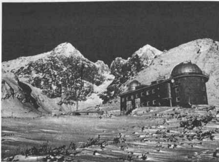
Obr. 1. Budova observatória Astronomického ústavu SAV na Skalnatom plese.

obr. 1). Umiestnil v ňom ďalekohľad z Hurbanova a aj časť hurbanovskej knižnice.