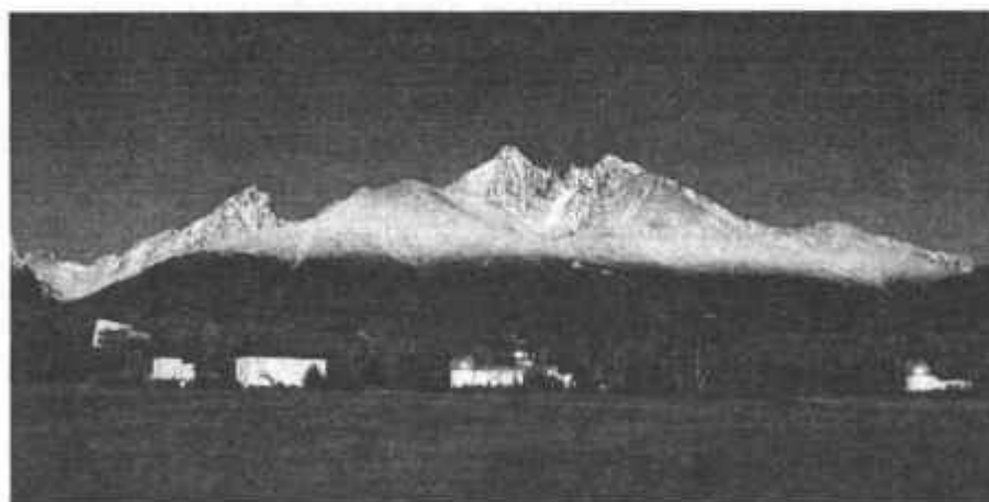
Obr. 2. Nový areál ústavu s hlavnou budovou v pozadí.

Od roku 2001 sa naplňala databáza kníh v systéme ISIS a katalogizácia trvala do roku 2003. Časopisy doteraz nemáme počítačovo spracované. V súčasnosti knižničný fond tvorí 9208 kníh a 138 elek-