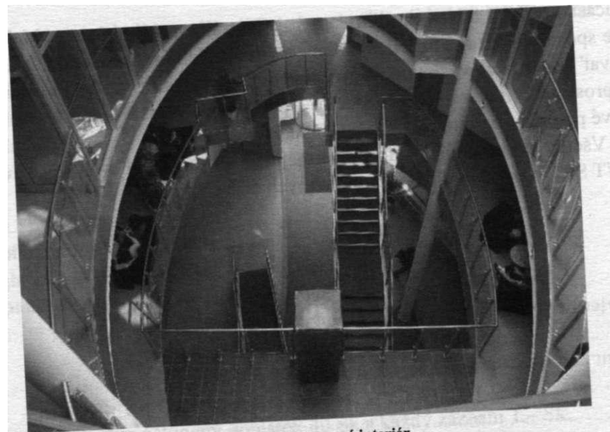
Zaujímavý vstupný interiér

Od vlani pôsobí na základe rozhodnutia Ministerstva školstva SR v rámci CVTI SR Národné centrum pre popularizáciu vedy a techniky v spoločnosti , ktoré buduje centrálny informačný portál pre vedu, výskum a inovácie.