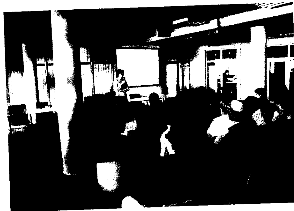
Pohľad na účastníkov pracovného stretnutia