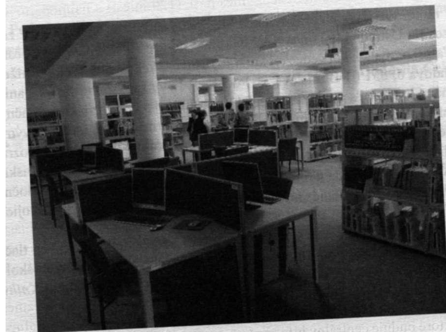
Pohľad do študovne