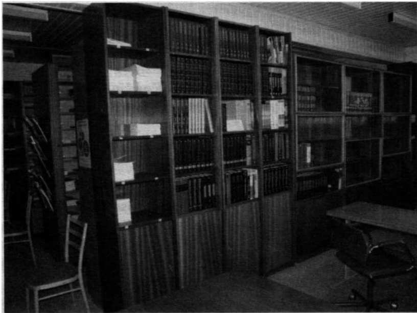
Výber encyklopédií v časopiseckej čítarni na Patrónke

Ročný výkaz o knižnici za rok 2007 , ktorý je súčasťou Programu štátnych štatistických zisťovaní a jeho vyplnenie vyplýva z paragrafu 18 zákona č. 540/2001 Z. z. o štátnej štatistike, vyplňali knižnice SAV v internetovej verzii. Zaregistrovaný výkaz v databáze Ministerstva kultúry SR a jeho vytlačenu verziu, overenú zodpovedným štatutárom ústavu, knižnice postúpili do Ústrednej knižnice SAV na záverečnú kontrolu a odsúhlasenie v uvedenej databáze. Vytlačené verzie výkazov ÚK SAV doručila do Slovenskej národnej knižnice v Martine, kde sa budú archivovať nasledujúcich desať rokov.