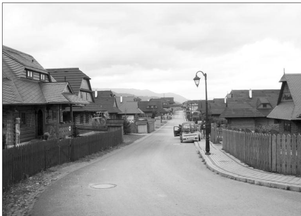
Dve podoby jednej obce - staré chalupy (hore) versus nové Chalúpkovo (dole) v Liptovskej Štiavnici.