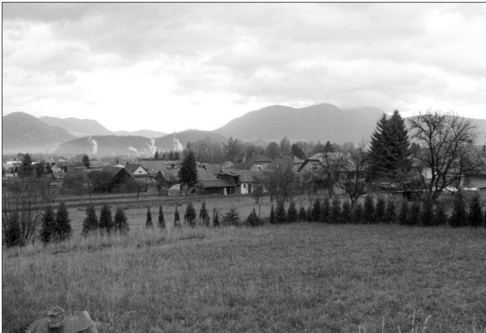
Dolnoliptovská obec Liptovská Štiavnica v zázemí mesta Ružomberok (dymiace komíny), v pozadí dominujú Chočské vrchy.