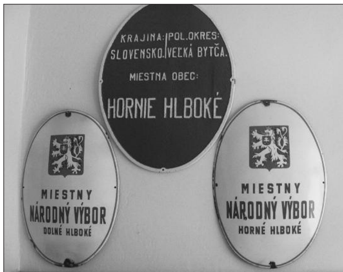
Obr. 2 – Exkurz do identity obce. Tak, ako je osobná identita človeka daná jeho príslušnosťou k rôznym kolektívnym entitám, je identita obce definovaná jej príslušnosťou k hierarchicky vyšším regionálnym celkom. Zároveň je vytváraná identitami svojich „subregiónov“.

hodnutiach obce. Boli ešte niekedy v 90. rokoch tendencie časti Pod Horou sa odčleniť od našej obce a pričleniť sa k susednej obci. Obyvatelia tejto časti obce sa tak nepriamo separujú od nás.“ (Zamagurie) Na druhej strane však môže rôznorodosť v rámci obce prinášať oživenie miestneho života (všimnime si paralelu s väčším regiónom Európy a ideou „jednoty v rozmanitosti“): „Je tu to povedomie po jednotlivých osadách, že my sme ‘Modrákovci’, my sme ‘Belákovci’ a podobne (názvy pozmenené autorom, pozn.). Teraz to človek ani tak nepocituje, ale keď sme boli mladí, tak jednoducho vždy sme viedli súboje (smiech, pozn.), napr. v rámci športových podujatí. Aj priateľstvá sa nadväzovali po tých jednotlivých osadách a menších ‘lokalitkách’ v rámci obce.“ (Kysuce) Na záver diskusie o lokálnych identitách starosta oravskej obce dokonca označuje postupné miznutie identít miestnych častí (v danom prípade niekdajších samostatných obcí) za stratu: „Z hľadiska identity, kultúry a tradičných zvykov bolo spojenie týchto dvoch častí strata. Strata v tom zmysle, že sa nezachovali niektoré tie veci, napr. aj architektúra bola iná v tom Hornom Hámri (názov miestnej časti pozmenený autorom, pozn.).“