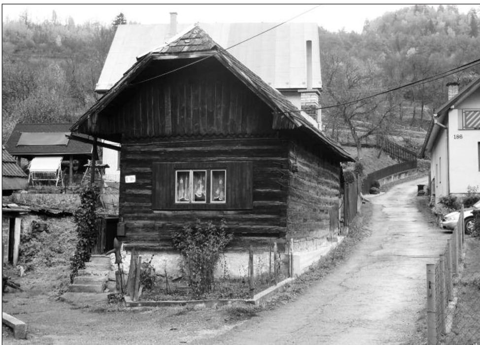
Objekt ľudovej architektúry v Hornom Hlbokom, bývalej obci (dnes súčasť Hlbokého nad Váhom) zasadenej „hlboko“ do Súľovských vrchov.