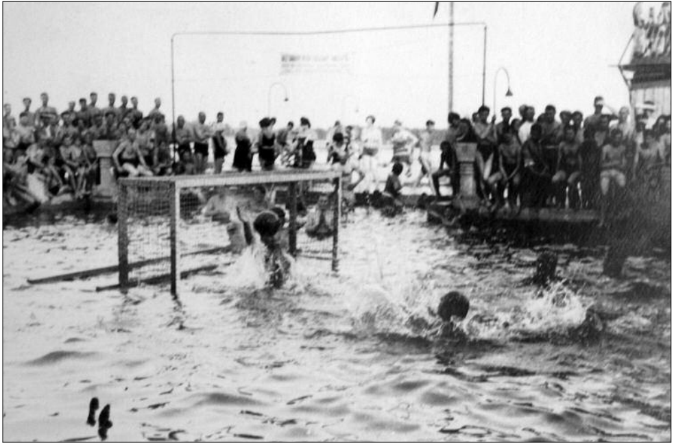
Historicky prvý zápas medzi ŽPSK Bar Kochba Bratislava a I. ČsŠK Bratislava.