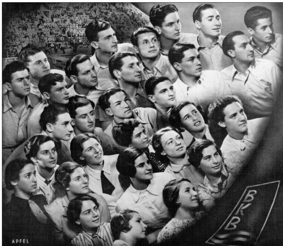
ŽPSK Bar Kochba Bratislava – klubový majster ČSR 1937.