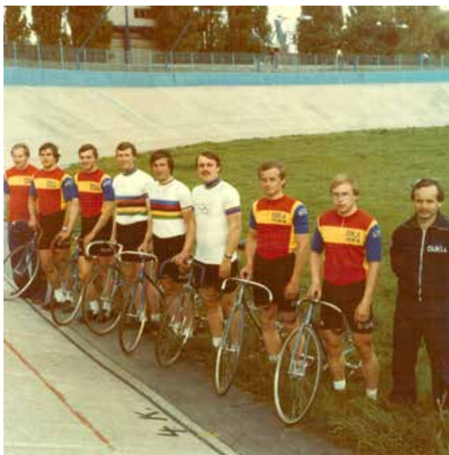
AŠD dráhovej cyklistiky ASVŠ Dukla Trenčín (1978)