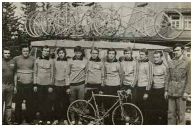
Cyklistický oddiel Spartak SZM Dubnica (1975)