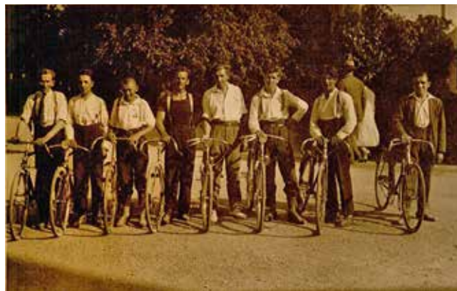
Klub cyklistov Trnava (1936)