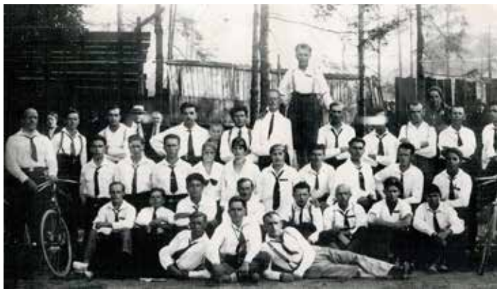
Cyklistický odbor Robotníckej telocvičnej jednoty (1928)

ľa osobitného služobného predpisu K-I-6 – cyklistická eskadróna. Výučba jazdy na bicykli bola zaradená aj do predmetu telesná výchova na Vojenskej akadémii v Hraniciach na Morave. Ovládať jazdu na bicykli bolo povinnou zručnosťou pre dôstojníkov, podobne ako jazda na koni či šerm. Popularitu cyklistiky signalizovalo množstvo súťaží, ktoré sa začali organizovať. Medzi najznámejšie patrili preteky Bratislava – Trnava, Bratislava – Malacky, Košice – Prešov a Sabinov – Prešov. V zoznamoch víťazov môžeme nájsť mená Kelemen, Kardoš, Vavrek, Brutovský a už spomínaný Lepier. Stále však išlo len o jednoetapové preteky. Prvé viacetapové súťaže sa z iniciatívy Košického atletického klubu (KAC) uskutočnili v roku 1928 pod názvom Košice – Tatry – Košice. V medzivojnovom období sa cyklisti z Československa zúčastňovali aj na medzinárodných podujatiach vrátane olympijských hier. Tam by sme však cyklistov zo Slovenska márne hľadali. Svojou výkonnosťou ani zďaleka nedosa-