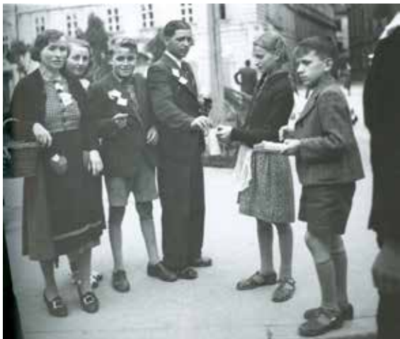
Zimná pomoc

širokých ľudových vrstiev. V neposlednom rade sa mal uľahčiť administratívny styk so stránkami.