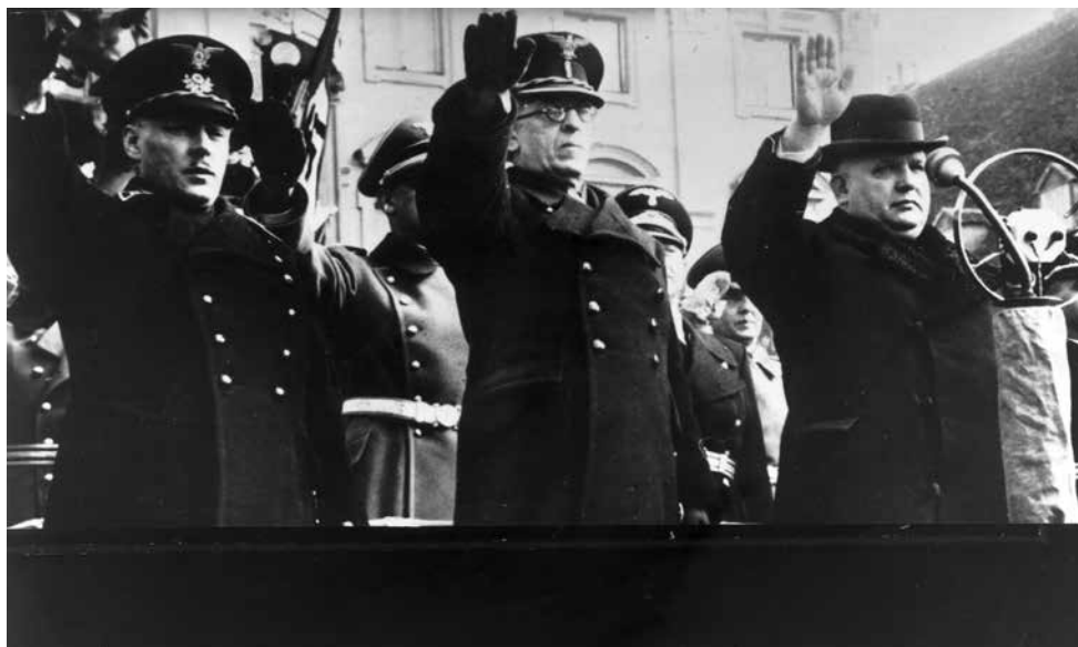
Poprední činitelia Slovenského štátu. Zľava: Gejza Medrický, Vojtech Tuka a Jozef Tiso

ROGUĽOVÁ, Jaroslava. From the life of Notaries. A Look into the Micro-world of the Wartime Republic. História , 2017, 16, 4, pp. 36-39.