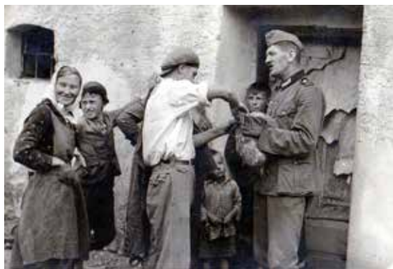
Nemecký vojak s domácim obyvateľstvom – Jablonové

obyvateľstva a rôznych sociálnych či profesijných skupín k štátu. Dokazuje, že dejiny nie sú ani čierne, ani biele, ale mnohvrstevné. Politické zmeny, prevraty a režimy, ktorých sa u nás v 20. storočí vystriedalo niekoľko, kládli pred úradnícky stav nielen profesionálne, ale aj osobné otázky a dilemy, či a do akej miery sa s novými štátnopolitickými pomermi stotožniť. Každý režim od neho vyžadoval lojalitu a spoľahlivosť, keďže verejná správa je jedným z pilierov štátu. Pri striedaní politických režimov sa veľká časť úradníckeho aparátu dedí. Platilo to aj o Slovenskom štáte, ktorý po marci 1939 prevzal úradníkov z Československa. Mnohí po absolvovaní previerok a zložení prísahy pokračovali v práci v novom režime. Niektorí z nich politické zmeny uvítali, k štátu boli lojalní z presvedčenia a akceptovali požiadavku vysokej angažovanosti na podporu režimu. Veľká časť úradníkov na rôznych stupňoch správy sa však zapojila do odboja a bojovala proti tomuto štátu.