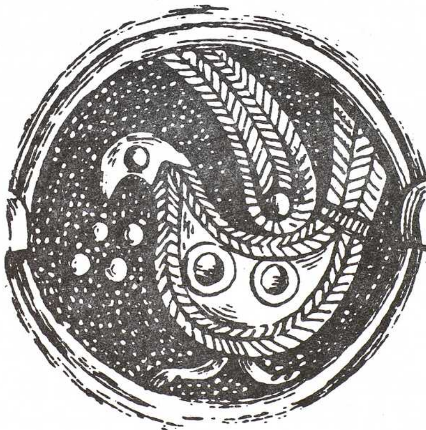
Štylizovaná holubica na plášti strieborného veľkomoravského gombíka, 9. storočie.