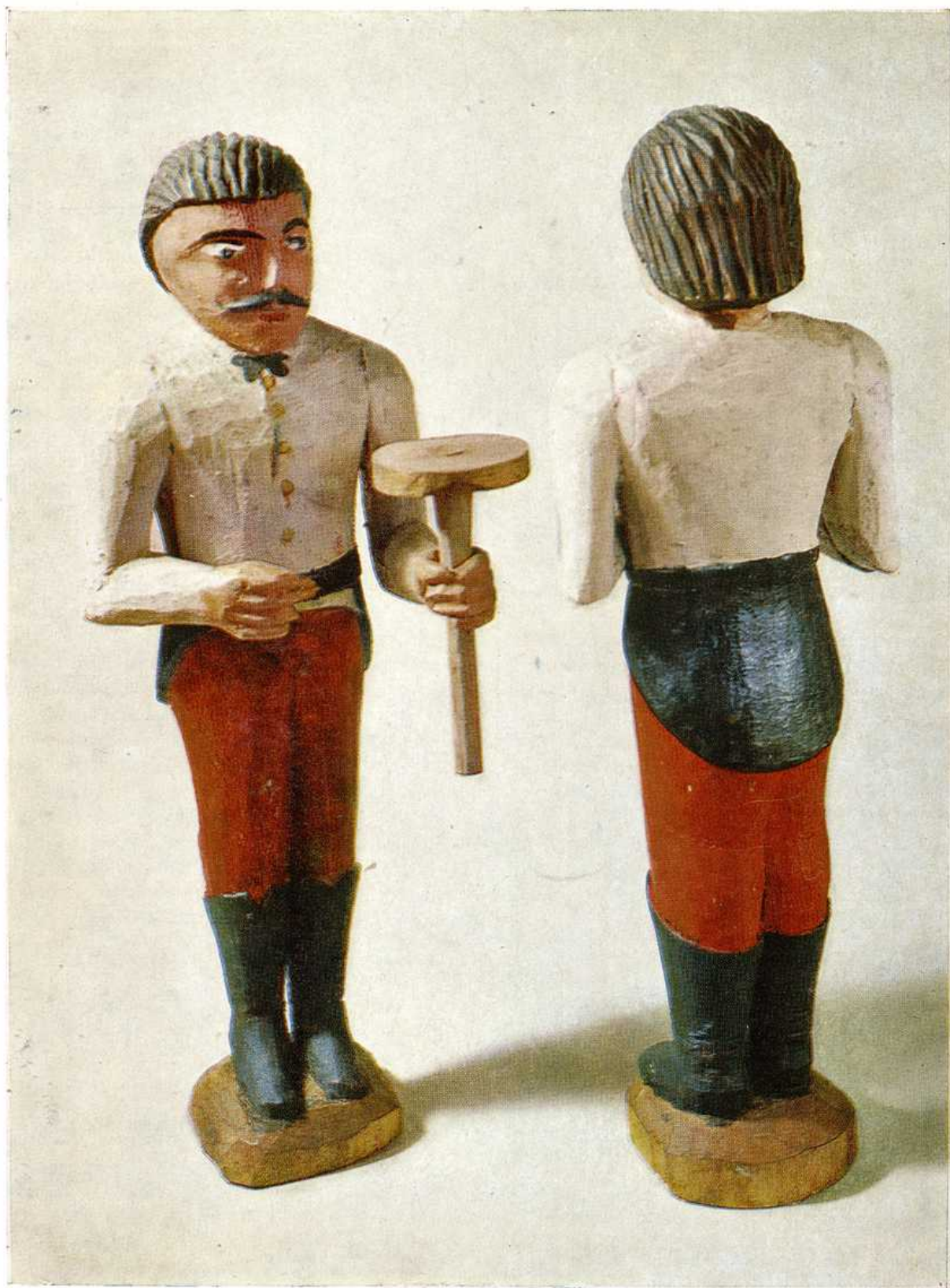
Postavy baníkov so svietnikmi, drevorezba zo zač. 20. stor., okolie Banskej Štiavnice. Zbierky Slovenského národného múzea, Bratislava.