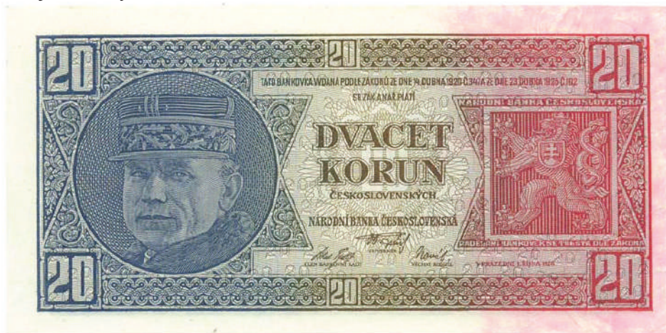
Obrázok č. 6. Československý (v skutočnosti český) text na lícnej strane 20-korunovej bankovky vzoru 1927.

Na rubovej strane sa popri/pod štátnym jazykom uvádzala hodnota bankovky aj v rusinskom/ukrajinskom, nemeckom a maďarskom jazyku; poľský jazyk však (ako sme vyššie spomenuli) zmizol. Uvádzanie textu na bankovkách v menšinových jazykoch umožnil 2. odsek 13. článku nariadenia z r. 1926: „Hodnota papírových platidiel bude na rubu vyznačena podle potreby též jazyky, jimiž mluví menšiny republiky Československé.“ 12