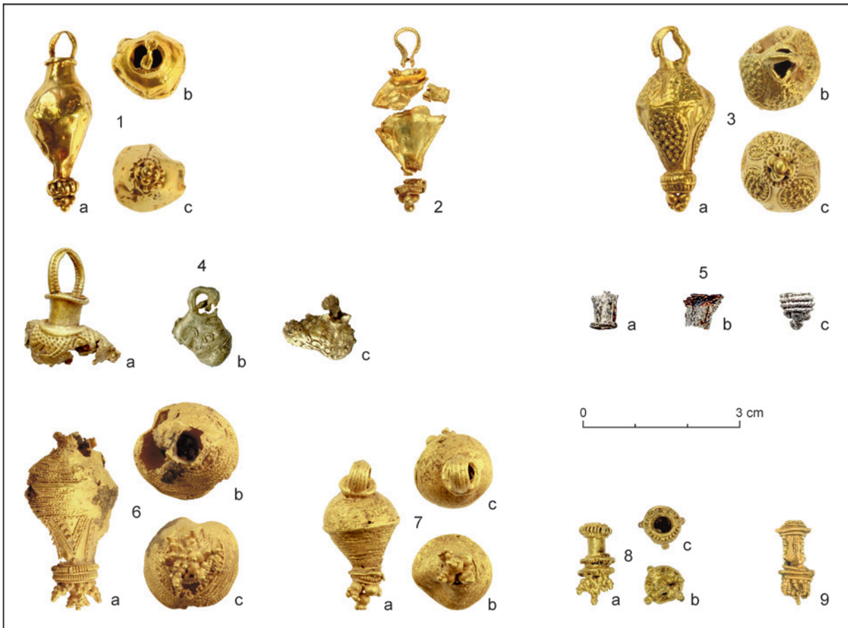
Obr. 3. 1 – Abrahám, zlatý hruškovitý závesok z germánskeho pohrebiska, hrob 208 (podľa Rajtár 2013 , obr. 5: a); 2 – Abrahám – fragmenty zlatého hruškovitého závesku z germánskeho pohrebiska, hrob 210 (podľa Rajtár 2013 , obr. 5: b); 3 – Očkov, zlatý hruškovitý závesok z germánskeho pohrebiska, hrob 69 (podľa Rajtár 2013 , obr. 5: c); 4 – Sekule, tri fragmenty zlatých hruškovitých záveskov objavené počas prospekcie germánskeho pohrebiska; 5 – Sekule, tri fragmenty strieborného hruškovitého závesku objavené v žiarovom hrobe 40/2017 na germánskom pohrebisku; 6 – Zohor, zlatý hruškovitý závesok objavený v germánskom žiarovom hrobe 8/2005 (podľa Rajtár 2013 , obr. 5: g); 7 – Zohor, zlatý hruškovitý závesok objavený povrchovou prospekciou na germánskom pohrebisku (podľa Rajtár 2013 , obr. 5: e); 8 – Hamuliakovo, fragment spodnej časti zlatého hruškovitého závesku objaveného na germánskom sídlisku (podľa Rajtár 2013 , obr. 5: f); 9 – Želiezovce, fragment spodnej časti zlatého hruškovitého závesku objaveného povrchovou prospekciou v okolí Želiezoviec.

V hrobe 40/2017 z rovnakého pohrebiska v Sekuliach boli objavené tri fragmenty spodnej časti strieborného závesku hruškovitého tvaru (obr. 3: 5). Na dvoch z nich sú stopy po korózii železa. Postupne zužujúca sa spodná časť bola zdobená niekoľkými vertikálne bežiacimi pásmi z prepletených strieborných drôtikov. Medzi nimi sa nachádzali hladké nezdobené plochy. Ukončený je tromu neúplnými venčekmi z drôťku, ktorý bol zhotovený stočením dvoch strieborných drôťkov do jedného. Nasledovala trojica venčekov z perlovca, pod ktorou sa nachádza 5 strieborných granuliek v tvare pyramídky. Fragmenty závesku možno priradiť k Müllerovmu prechodnému typu II/III ( Müller 1956 ).