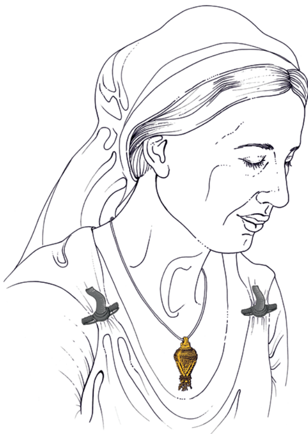
Obr. 1. Rekonštrukcia podoby germánskej ženy pochovanej v žiarovom hrobe 8/2005 v Zohore. Na krku má zlatý hruškovitý závesok, ktorý bol zvyčajne zavesený na šnúrke spolu so sklenenými alebo jantárovými korálikmi. Na kresbe tieto koráliky chýbajú vzhľadom na to, že nebola vykonaná flotácia hrobovej výplne, a tak sa sklenené zliatky ani koráliky iného druhu nepodarilo objaviť. Kresba J. Marettová.