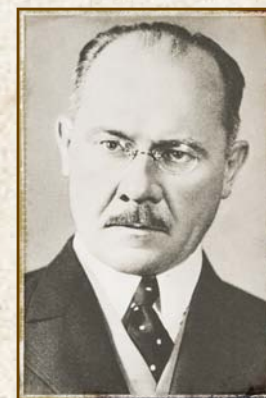
MILAN HODŽA 1878 — 1944