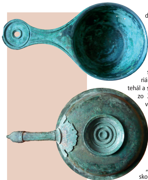
▲ Kniežací hrob, panvica s kolkom výrobcu – Cippius Polybius

Pan from the princely grave with the master-stamp of Cippius Polybius