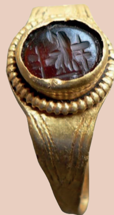
Zlatý rímsky prsteň s gemou (orol s vavrínovým vencom stojaci medzi štandardami)