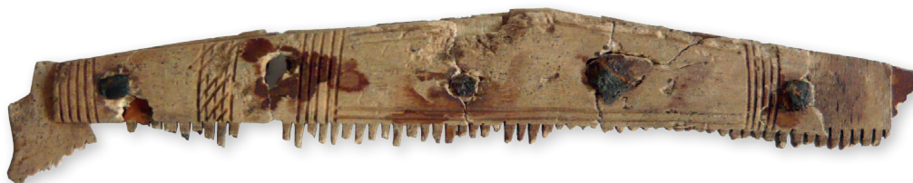
Kostený hrebeň, 8. storočie Bone comb, 8th century AD