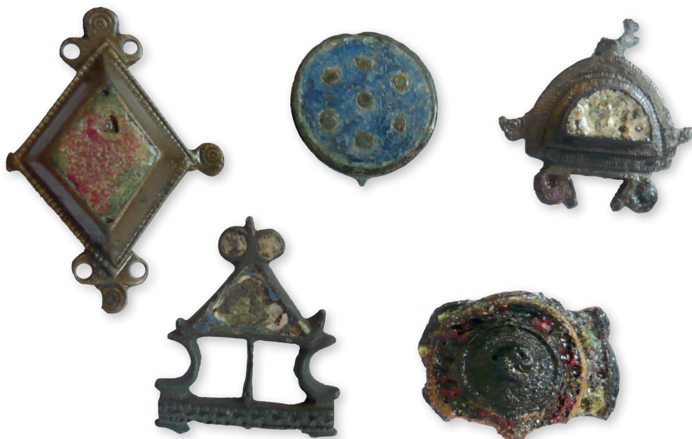
Rímske emailové spony, 2. – 3. storočie

Najvýznamnejším objavom v minulom roku je nález neporušeného komorového kostrového hrobu germánskeho veľmoža. Patrí tak ako už dávnejšie