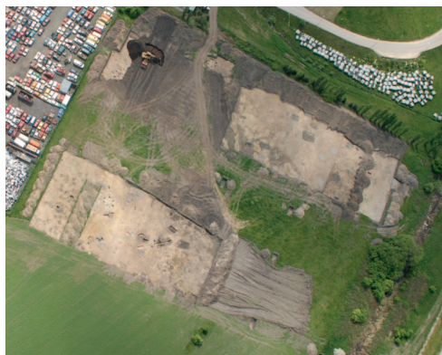
Kniežací hrob odkrytý v roku 2010

Rímske mince začínajú republikánskymi razbami z 2. storočia pred n. l. a končia neskororímskou razbou Honoria (408 – 423 n. l.). Germánske osídlenie tu začína krátko po zlome letopočtu v období vlády cisára Tibéria (14 – 37 n. l.) a svedčí o dôležitom postavení sídliska už za vlády kráľa germánskych Kvádov – Vannia (približne roky 20 – 50 n. l.). Počas 1. a 2. storočia sa rozsiahle centrálné sídlisko stalo obchodným strediskom a sídlom germánskych elít, ktoré bohatli aj z colných poplatkov na Jantárovej ceste. Ďalší rozmach osídlenia je doložený po tzv. markomanských vojnách, ktoré sa na strednom Dunaji odohrávali v rokoch 166 až 180 n. l. medzi Rímskou ríšou a odbojnými germánskymi kmeňmi Markomanov, Kvádov, Sarmatov a ďalších. V roku 180 sa syn Marka Aurélia cisár Commodus vzdal myšlienky vytvoriť novú rímsku provinciu Markomániu, ktorú chcel na strednom Dunaji vybudovať jeho otec. V čase rozkvetu Panónie v prvej polovici 3. storočia za dynastie Severovcov (193 – 235) sa zlepšili vzťahy medzi Rimanmi a Germánmi, čo sa prejavilo zvýšenou obchodnou výmenou a tiež budovaním stavieb na rímsky spôsob, ktoré boli pravdepodobne