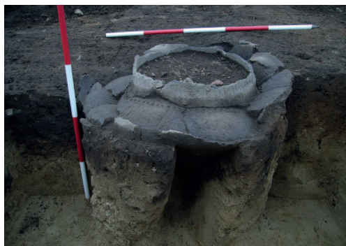
Zásobnica, bronzová doba Zohor, Bronze age, storage container