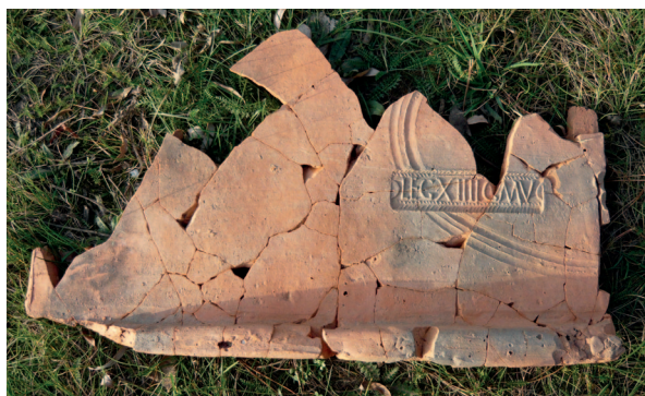
Rímska tegula s kolkom XIV. légie so sídlom v Carnunte Roman tegula with the stamp of the XIV Legion stationed in Carnuntum

žiarového pohrebiska a približne 30 až 50 m od kniežacieho hrobu nájdeného v roku 2010.