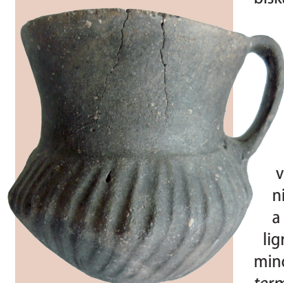
Džbánik z bronzovej doby Store vessel, Bronze age