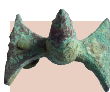
Kniežací hrob, spona a ostroha